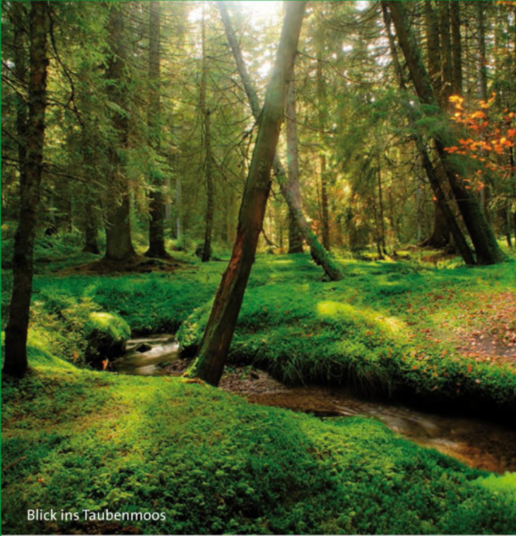
Blick ins Taubenmoos