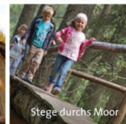
Stege durchs Moor