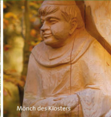
Mönch des Klosters