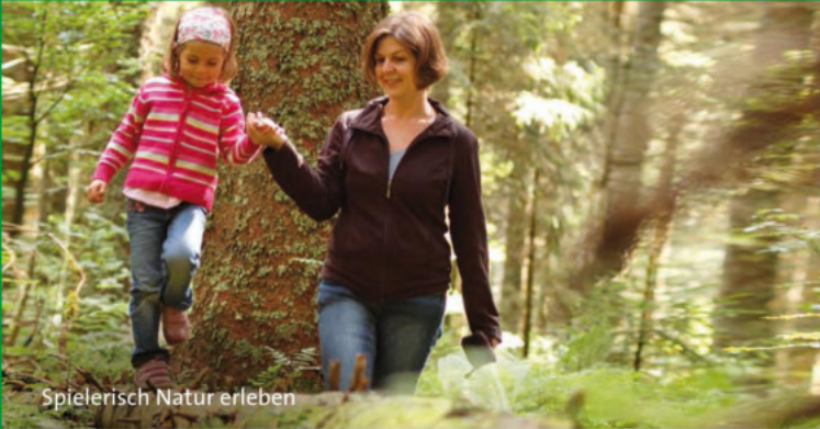
Spielerisch Natur erleben